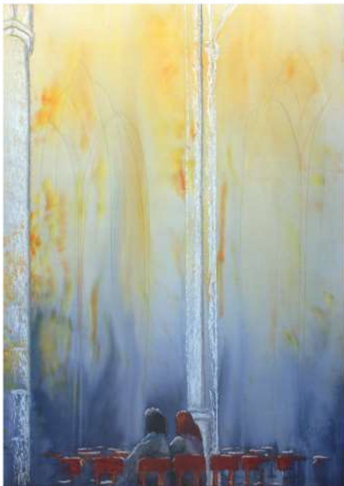
Bild: spirituelle Kunst von Michael Willfort, Galerie: www.kunst2day.de

Wo es finster bestellt ist in uns selbst, in der Kirche und in dieser Welt, sehnen wir uns nach dem Licht. Wo alles verhärtet ist in Hass und Kälte, sehnen wir uns nach Liebe und Wärme. Wir brauchen Gottes Geist in uns selbst, in der Kirche, in der Welt. Wir brauchen Pfingsten.