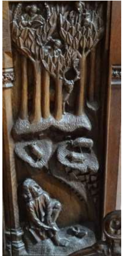
In St. Godehard, Hildesheim